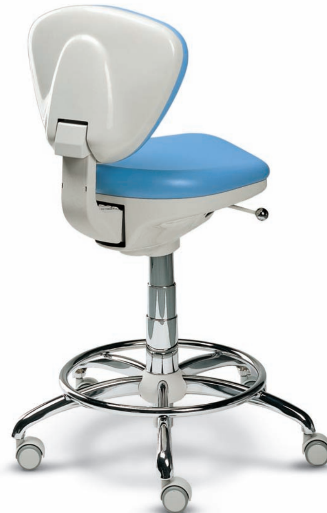
SYNCRO T5 Seggiolino anatomico medico

Il sedile anatomico ed il movimento sincronizzato dello schienale permettono al medico di sedere nella posizione più comoda e corretta.