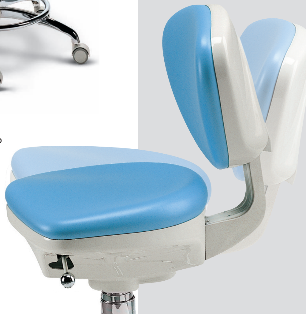
SYNCRO T3 Seggiolino anatomico medico