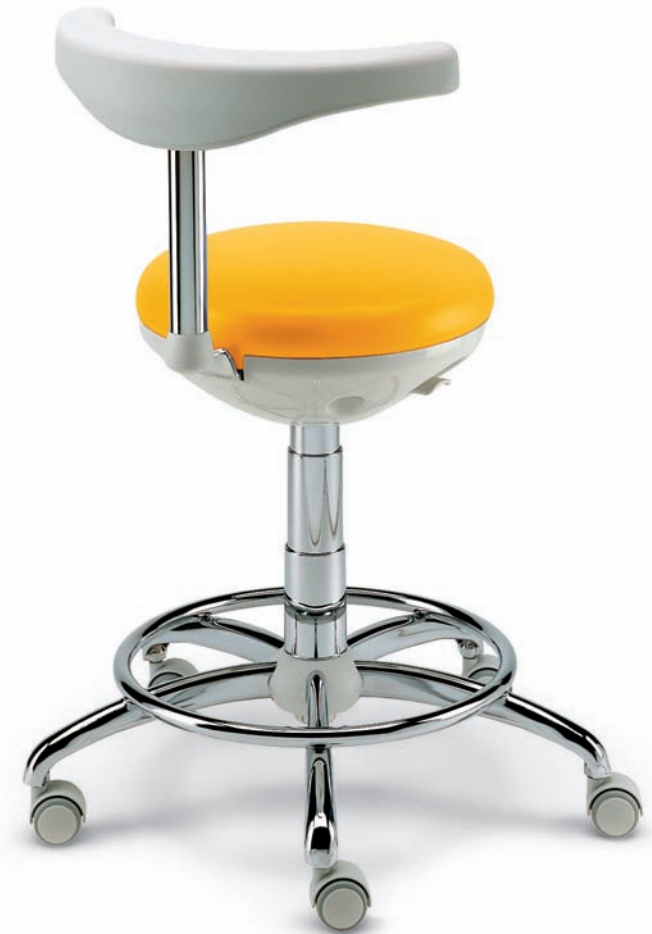
ASSIST Seggiolino anatomico assistente

Il sedile rotondo e lo schienale-bracciolo semitondo, permettono all'assistente di sedere comodamente, mantenendo la massima rapidità operativa.